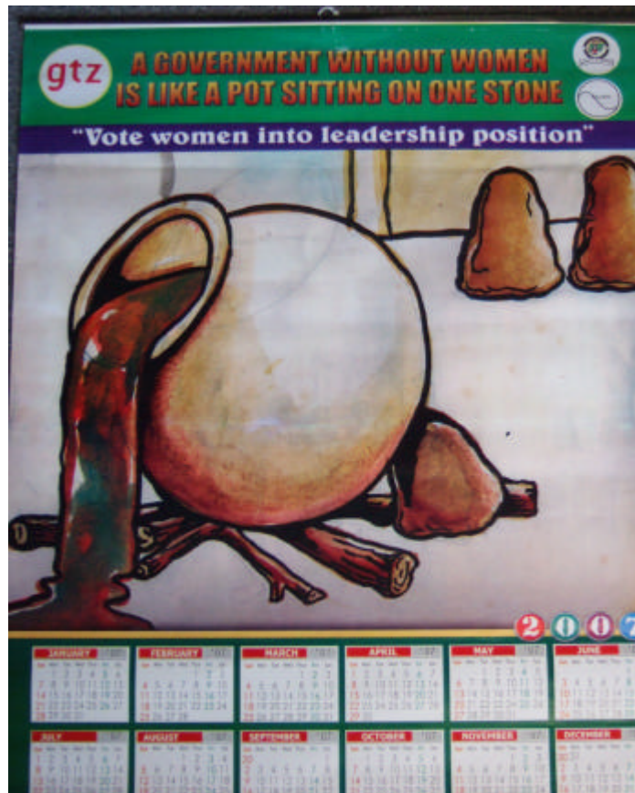
Kalender der GTZ in Borno State, Nigeria

Auch die Rechtsberatung, die für Frauen organisiert wird, hat einen hohen Stellenwert. Denn das ist die einzige Chance für Frauen, Rat in Rechtsfragen z.B. über die Unterhaltungspflicht bei nachgewiesener Vaterschaft, zu erlangen. Außerdem arbeiten die GTZ-Mitarbeiterinnen daran, dass die „Gesetze“ hinterfragt werden, die es ermöglichen, dass Mädchen schon mit 10 bis 11 Jahren verheiratet werden oder dass Straßenkinder ihrem Schicksal überlassen bleiben.