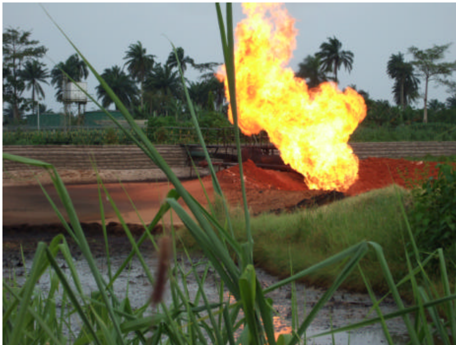
Brennendes Shell-Bohrloch Umuechem

Anschließend konnte ich an einer Fahrt Richtung Port Harcourt teilnehmen, die eine Stippvisite bei einer künftigen Keramikfabrik in Abia ermöglichte sowie die Besichtigung eines unkontrolliert brennenden Bohrlochs, der Shell-Förderstation und des Dorfes Umuechem im Niger-Delta umfasste.