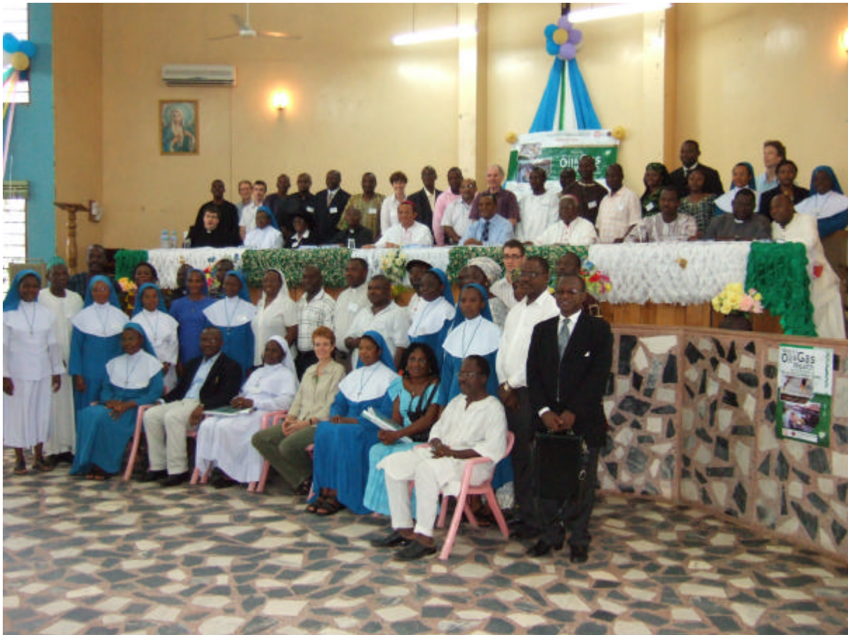
Abschlussfoto der Konferenz in Nigeria, 3. Nov. 2006

Mit dieser Keramikfabrik wird konkret etwas zur wirtschaftlichen Verbesserung der Menschen in dieser Region getan. Ich bin sehr gespannt, ob die Fabrik tatsächlich Mitte 2007 in Betrieb gehen wird und so die Hoffnungen erfüllt, dass Arbeitsplätze geschaffen werden.