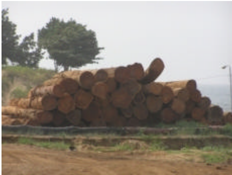
Stämme im Hafen von Kribi.

In der deutschen Entwicklungszusammenarbeit mit Kamerun ist die nachhaltige Nutzung der natürlichen Ressourcen neben der Gesundheit und der Dezentralisierung ein Schwerpunkt.