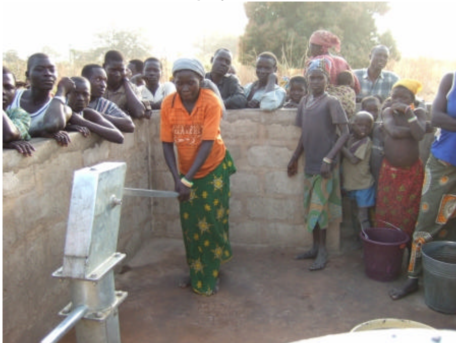
Das Wasserholen ist Frauenarbeit - Brunnen in einem Dorf in der Gegend von Gounou-Gaya, Tschad.

Wegen unserer Verspätung werfen wir nur kurz einen Blick auf das Sparkassengebäude und fahren weiter zu einem Brunnenbauprojekt .