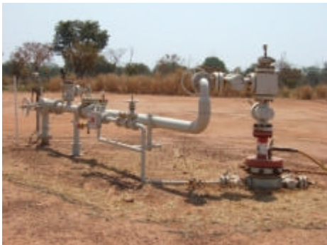
ein Ölbrunnen in Komé

Erste Explorationsen fanden 1969 statt. Die eigentliche Erdölproduktion begann erst 2003 nach der Fertigstellung der Tschad-Kamerun-Pipeline. Das in den Erdölfeldern um Doba geförderte Erdöl – „Doba Blend“ – ist ein besonders schweres Rohöl, das aber wenig Schwefel enthält.