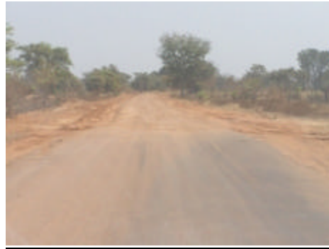
Hier endet der Kilometer asphaltierte Straße, mit dem die Weltbank das gerade durchfahrene Dorf entschädigt hat.

In Erinnerung geblieben ist den Menschen hier, dass die GTZ (es war GTZ-IS, aber dieser kleine Unterschied wurde nicht registriert) im Auftrag der Weltbank die einzelnen Dörfer besuchte, den Dorfcchefs Listen vorlegte mit verschiedenen Optionen für kommunale Entschädigungen (z.B. den Bau einer Schule mit zwei Räumen, die Asphaltierung eines Straßenstücks von 1 km Länge) und nach Auswahl einer dieser vorgegebenen Optionen vom Dorfcchef eine Unterschrift verlangte, wonach damit sämtliche Entschädigungsansprüche abgegolten seien.