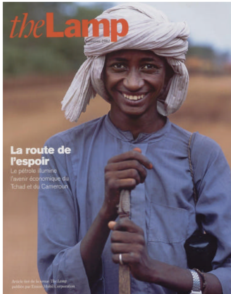
„Die Straße der Hoffnung. Das Erdöl erhellt die wirtschaftliche Zukunft von Tschad und Kamerun“, Artikel aus der Zeitschrift The Lamp der ExxonMobil-Corporation, Herbst 2002.

Laut Esso war das Jahr 2002 dasjenige mit den meisten Einstellungen. Ca. 7.800 Tschader fanden Arbeit, während etwa 2000 als „Expatriates“ aus anderen Ländern kamen. Mitte 2006 gab es noch 5.000 Arbeitsplätze für TschaderInnen, die Zahl der „Expatriates“ lag bei knapp 1.000.