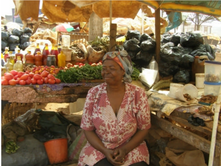
Eine stolze Marktfrau in Yaoundé, Mitglied der Genossenschaft MUFFA.

Mithilfe dieses Konzepts wird Frauen erstmals die Möglichkeit gegeben, eine unabhängige Existenz aufzubauen. Die Gespräche machten auch deutlich, dass dies sich auch positiv insbesondere auf die Kinder auswirke, da die Frauen auch Geld für deren Schulbesuch zurücklegten.