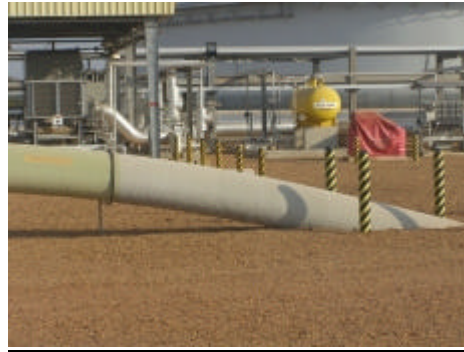
Hier verschwindet die Pipeline im Boden, das Öl beginnt die Reise nach Kamerun.

Die Pipeline ist einen Meter tief vergraben und hat einen Durchmesser von 79 cm. Durch 26 Ventile und eine ständige Überprüfung des Drucks an allen Ventilen sowie den Pumpstationen wird die Pipeline gesichert.