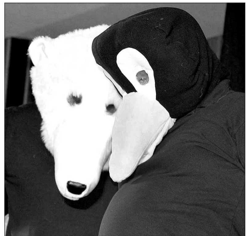
Eisbär und Pinguin – die Tiere von Nord- und Südpol spielen in einer der Szenen des Programms eine tragende Rolle.

44 Jahre: Stichlinge sind Deutschlands ältestes Amateurkabarett.