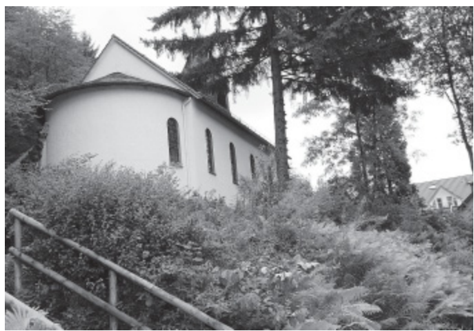
Verwunschen: So liegt die Hedwigs-Kapelle am Fuße des Tönsberges inmitten satteln Grüns da. Stufen führen hinunter zur Heimvolkshochschule.

Heimatvertriebene wollen nicht nur zusammen arbeiten, sondern auch gemeinsam beten