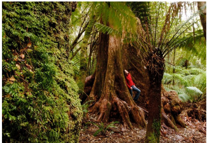
Tasmaniens Urwälder können aufatmen: 'Gunns' verzichtet auf die Zerstörung von 200.000 Hektar Urwald