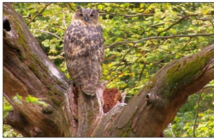
Tarnungskünstler: der Uhu.

Wenn das britische Militär die Senne verlässt – das ist bis spätestens 2020 geplant –, bietet es sich natürlich an, die Senne als einzigartige Natur ebenfalls in einen Nationalpark umzuwandeln. Dann könnte der neue Nationalpark „Teutoburger Wald - Senne“ heißen.