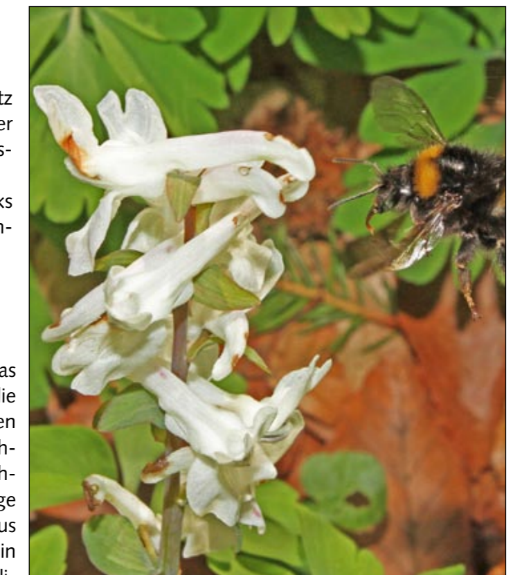
Seltene Pflanze: der Lerchensporn.

Nein. Es ist zwar das Ziel, mit allen Beteiligten eine einvernehmliche Lösung zu finden, aber selbst wenn dies nicht gelingt kann der Nationalpark im Teutoburger Wald eingerichtet werden.