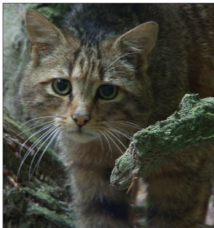
Menschenscheu: die Wildkatze.

Nach Abzug des Militärs wurde der Nationalpark eingerichtet. Hier hat sich in den letzten Jahren übrigens gezeigt, wie überaus positiv die Auswirkungen auf den Tourismus und die Wirtschaft im Allgemeinen sind.