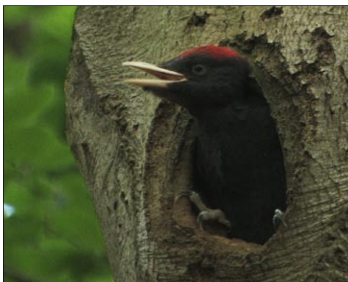
Sucht ein neues Zuhause im Nationalpark: der Schwarzspecht.

„Haben wir doch den Mut und Weitblick, auch den Teutoburger Wald als Nationalpark zu schützen. Die Nachfolgenden Generationen werden es uns danken.“