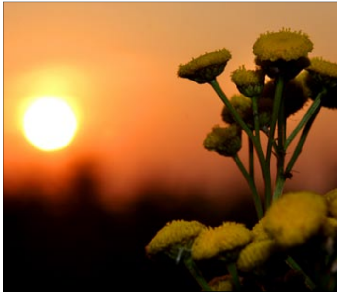
Die LTM freut sich auf einen Nationalpark im Kreis Lippe.

„Für die LTM bedeutet ein Nationalpark in Lippe genau das, was viele Bürger in Deutschland, Europa und der ganzen Welt damit verbinden: Ein Gebiet, in dem der Schutz von Pflanzen und Tieren groß geschrieben wird.“ Sein erstes Bild, so Weigel, sei dabei nicht das der betroffenen Lipper, sondern das Bild der Menschen in Lippe und weit darüber hinaus, bei denen ein Nationalpark positiv besetzt sei. Ein Park, der zum Besuch und zum Entdecken einlade, und das zuhause vor der eigenen Tür. „Ich habe ein gutes Gefühl, wenn ich weiß, dass der Nationalpark, die heimische Region einen wesentlichen Beitrag zum weltweiten Natur- und Klimaschutz leistet“, so Weigel. Das Thema sei nicht weit entfernt, son-