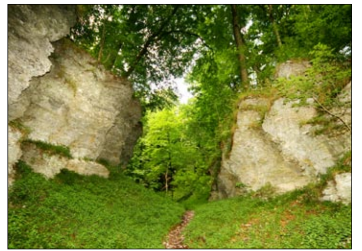
Einzigartig: die Bielsteinschlucht.

„Für einen Vermarkter ist ein Nationalpark also eindeutig willkommen, denn er verleiht uns und der Region ein weiteres positives Attribut“, so der LTM-Vorstand. „Damit hat der Nationalpark auch einen Effekt in Sachen Standortmarketing.“ Im Bereich Fachkräfte und deren Familien sei er ein deutliches Unterscheidungsmerkmal gegenüber anderen Konkurrenzregionen. „Im Wettbewerb um die besten Fachkräfte und die besten Standorte werden die sogenannten weichen Faktoren zukünftig ausschlaggebend sein“, so Günter Weigel.