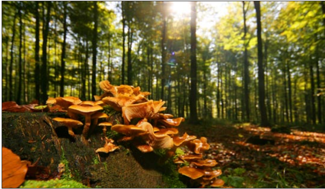
Totholz als Lebensraum: davon gibt es in bewirtschafteten Wäldern zu wenig. Im Nationalpark würde die Natur wieder die Regie übernehmen dürfen.