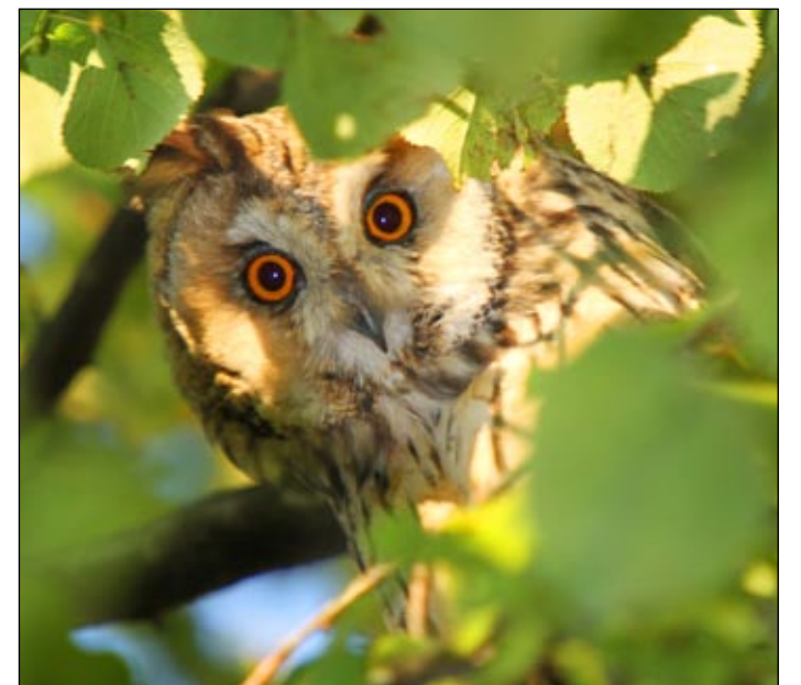
Gern gesehener Gast im Nationalpark: die Waldohreule.

ter der Idee des Nationalparks. Ein Nationalpark, davon bin ich überzeugt, ist eine große Chance für die Menschen in der Region und bietet gleichzeitig den nötigen Schutz, um dieses überaus wertvolle Naturerbe in Ostwestfalen-Lippe dauerhaft zu bewahren.“