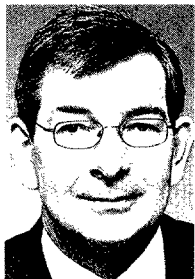
Christian Ruck (CDU/CSU)

forderungen durch Klimawandel, Hungersnöte und Wirtschaftskrise wird es aber künftig darauf ankommen, dass die Strategie- und Abstimmungsfähigkeit der Auftraggeber verbessert wird, um die Effizienz ihres beträchtlichen Mitteleinsatzes zu verbessern. Außerdem werden sie noch mehr mit der Privatwirtschaft zusammenarbeiten müssen, um mehr Synergieeffekte für Geber und Nehmer zu heben. Da muss Deutschland als einer der wichtigsten Geber die Initiative ergreifen.